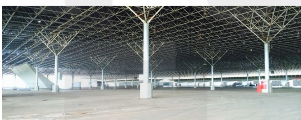
Foto: Pavilhão do Parque da Cidade

Os alojamentos: Pavilhão do Parque da Cidade, Pavilhão da Granja do Torto e Estádio Mané Garrincha estão estruturados para receber em partes as/os integrantes das caravanas. Eles contam com a seguinte infraestrutura disponível: